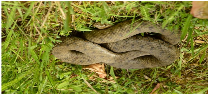
Водяний вуж.