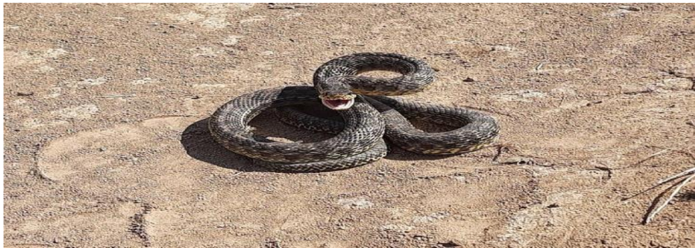
Сарматський полоз у захисній позі

Багато полозів живе на Дніпропетровщині, Миколаївщині, Запоріжжі, Донеччині.