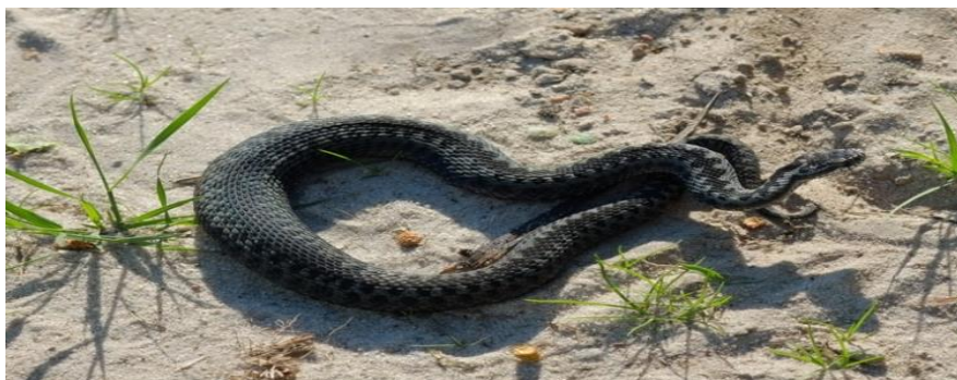
Гадюка звичайна.

Звичайні гадюки водяться на Закарпатті, Львівщині, Поліссі, а на Лівобережжі трапляються на Сумщині, Чернігівщині, Харківщині, Полтавщині. Гадюки не обов'язково сірі з чорним "зіпером" – можуть бути коричневі, майже чорні, голубуваті, і в усіх є зигзаг.