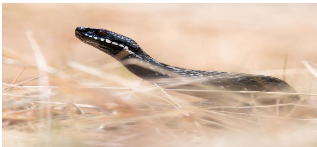
Гадюка звичайна, Київ.

В Україні є лише 2 види отруйних змій – це гадюки , але їх не вважають смертельно отруйними.