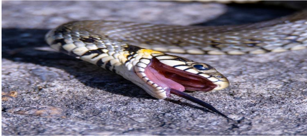
Вуж звичайний імітує смерть з метою самозахисту

прикидатися мертвими. Можуть пустити трохи крові з рота, викручуватись, висолоплювати язика, випорожнюватись, дуже сильно смердіти і робити усе, щоб ви, як потенційний хижак, передумали мати з ними справу.