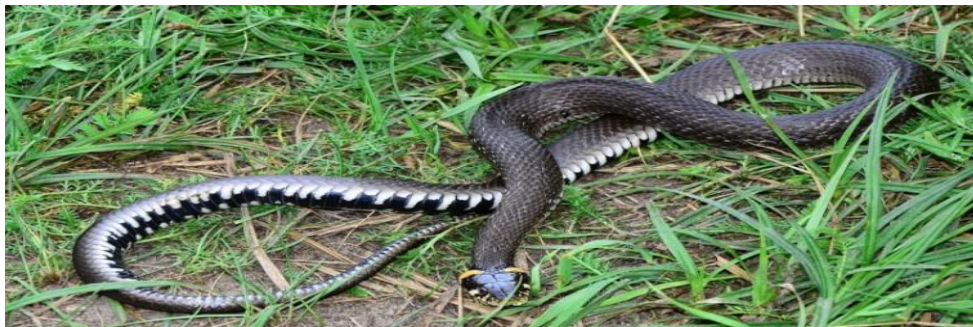
Зверніть увагу на жовті вухка.

Характерною ознакою вужа звичайного є чудові жовті "вухка". Вони можуть бути білуваті, помаранчеві, навіть блідо-червоні.