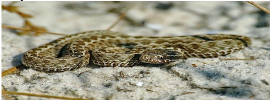
Степова гадюка

Гадюка степова поширена в степу, у лівобережних регіонах. Останнім часом цей вид реєструють і на правобережжі, але це поодинокі випадки. Зазвичай довжина тулуба степової змії становить менше 60 см, йдеться у Червоній книзі України . Хвіст короткий (4-6 см у самок і 5-8 см у самців). Характерна ознака степової гадюки – зигзагоподібний візерунок на світлій смузі . У звичайної гадюки такої смуги немає.