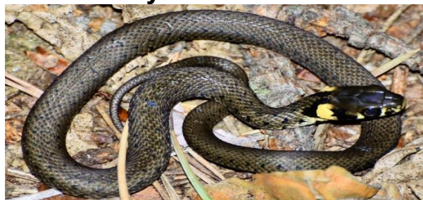
Вуж звичайний.