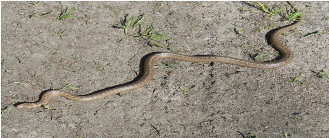
Мідянка звичайна.

Мідянка занесена до Червоної книги України .