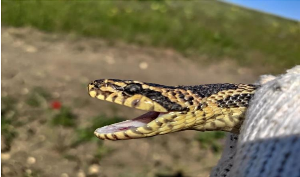
Сарматський полоз має "масочку" на обличчі

Зазвичай сарматський полоз мешкає на півдні. "Найпівнічніше" його реєстрували на Полтавщині та Кропивниччині.