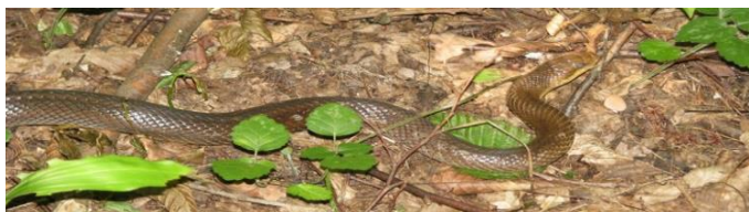
Полоз лісовий.

Полоз лісовий Лісовий полоз (або ескулапів полоз) – велика однотонна змія коричневого кольору. Може мати коричнево-чорне забарвлення з білуватим черевом.